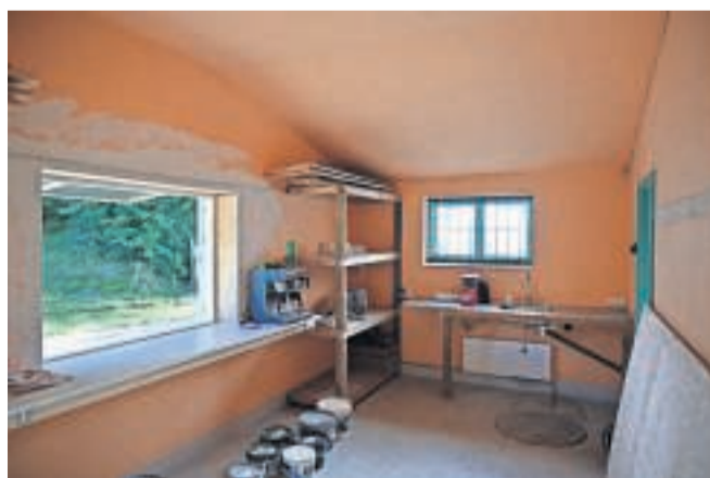
Selvom hylderne indtil videre står tomme, kan man allerede nu hente bænke og borde til terrassen eller tage sig en kop kaffe.