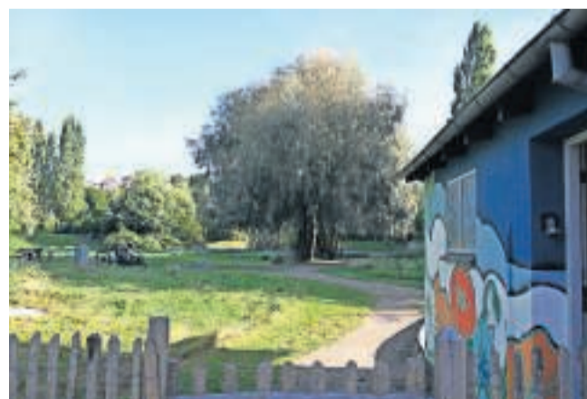
Foreningen for Naturlegepladsen Svendborg har også opsat et hegn ud til den trafikerede vej Dronningemaen.