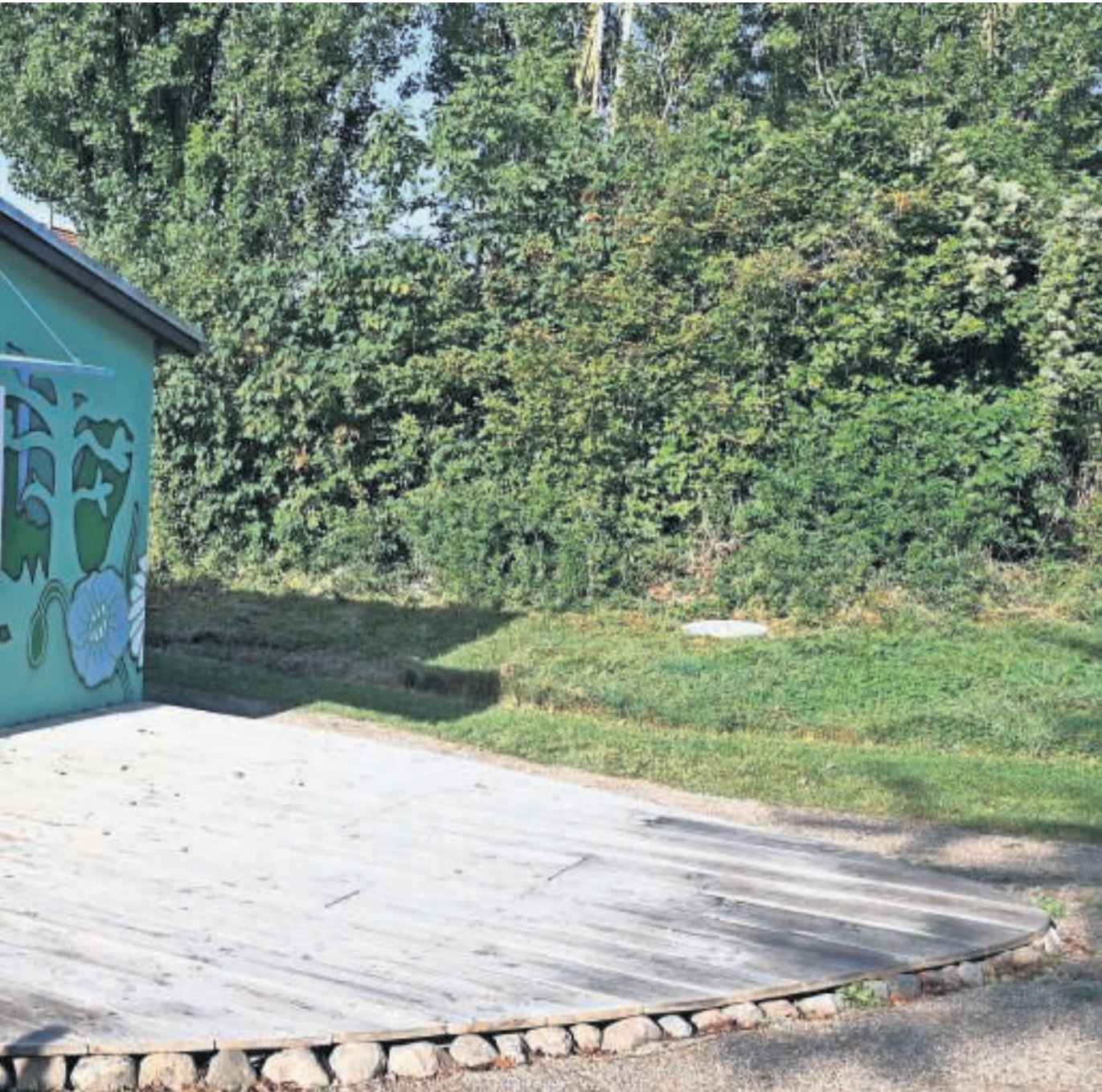
Naturlegepladsens hovedbygning er blevet istandsat, og har blandt andet fået sig en terrasse, hvor der kan slås borde og bænke ud.